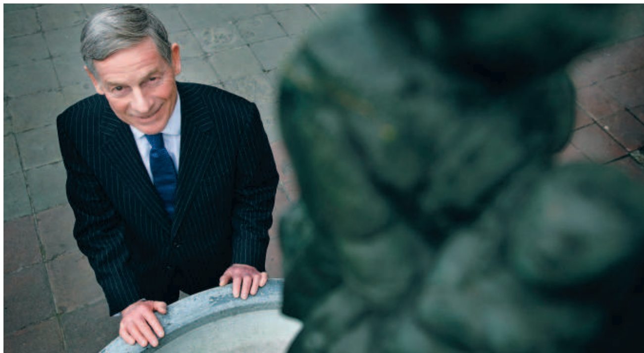
■ Harvey Mansfield: 'Vrouwen verlangen bescheidenheid en huiselijkheid. Seksuele onafhankelijkheid leidt alleen maar tot verdriet en eenzaamheid.'

Harvey C. Mansfield: "Mannelijkheid en geweld gaan inderdaad samen. Als je bereid bent op te komen voor datgene waar je in gelooft, zul je soms geweld moeten gebruiken. Maar belangrijker dan dat geweld op zich zijn de woorden die het justifyen. Ik vind assertiviteit heel belangrijk. Je moet volledig achter je woorden staan, ook al weet je dat ze niet voor de volle honderd procent waar